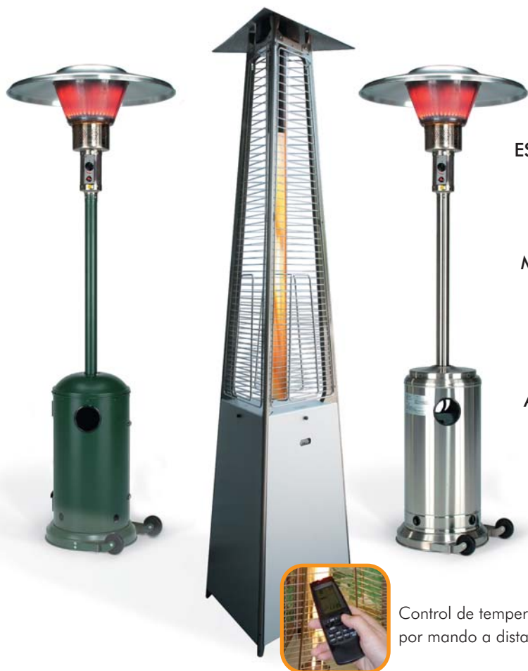
Control de temperatura por mando a distancia

CE Cumplimiento terminante de las normas europeas vigentes. Homologación CE y certificación DVGW para todos los estados europeos.